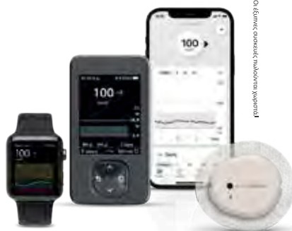
Οι βίβες ορατές πηλώνουν χωριστά

ευκολότερο στο* να επιτύχετε διαρκή αποτελέσματα†,†,†,† για τους ασθενείς σας